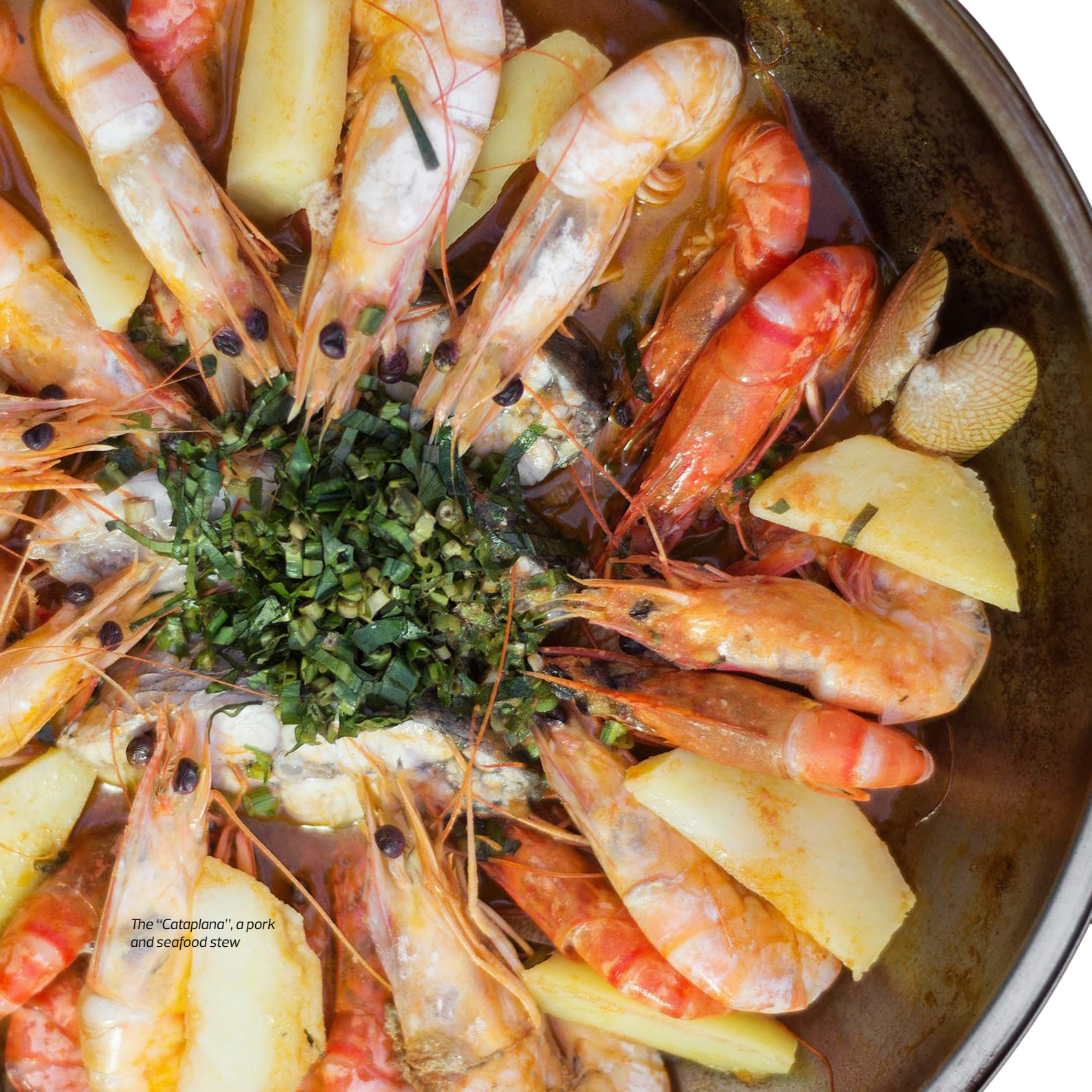
The "Cataplana", a pork and seafood stew