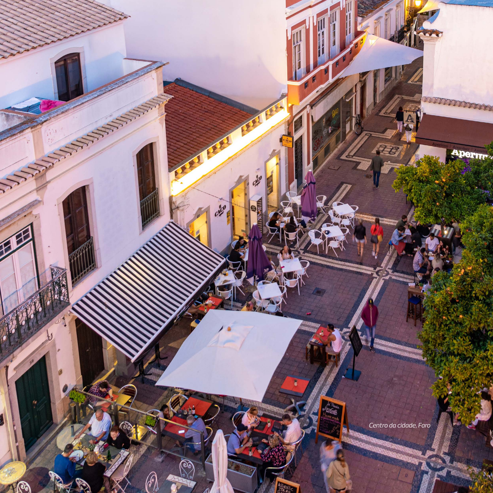
Centro da cidade, Faro