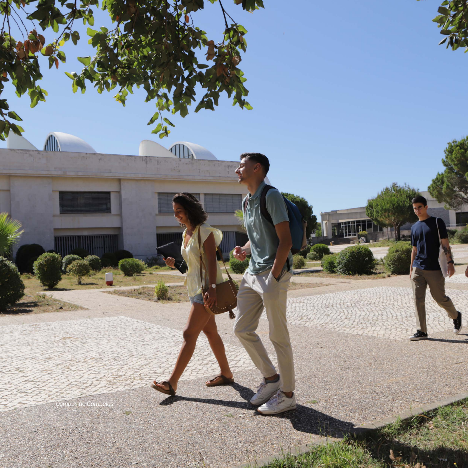
Campus de Gambelas