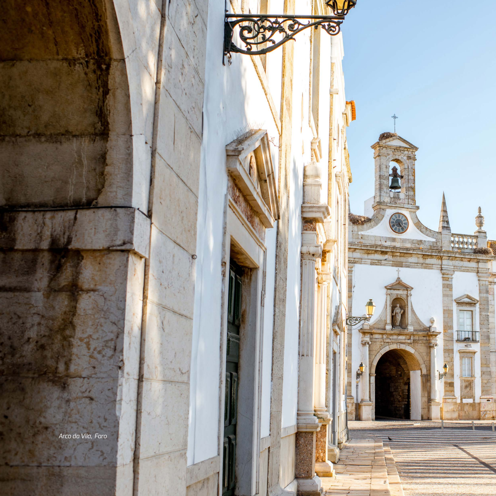
Arco da Vila, Faro