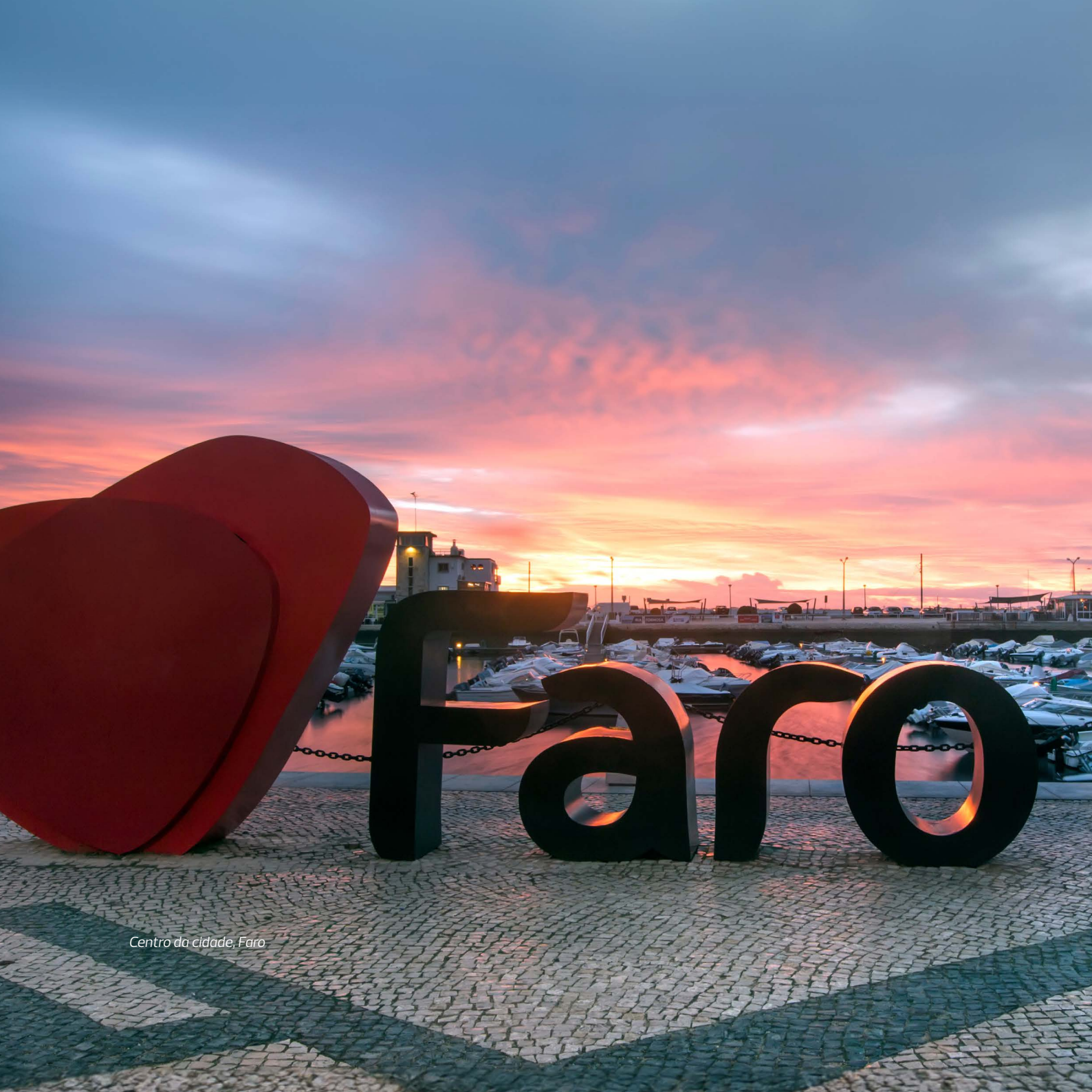
Centro da cidade, Faro