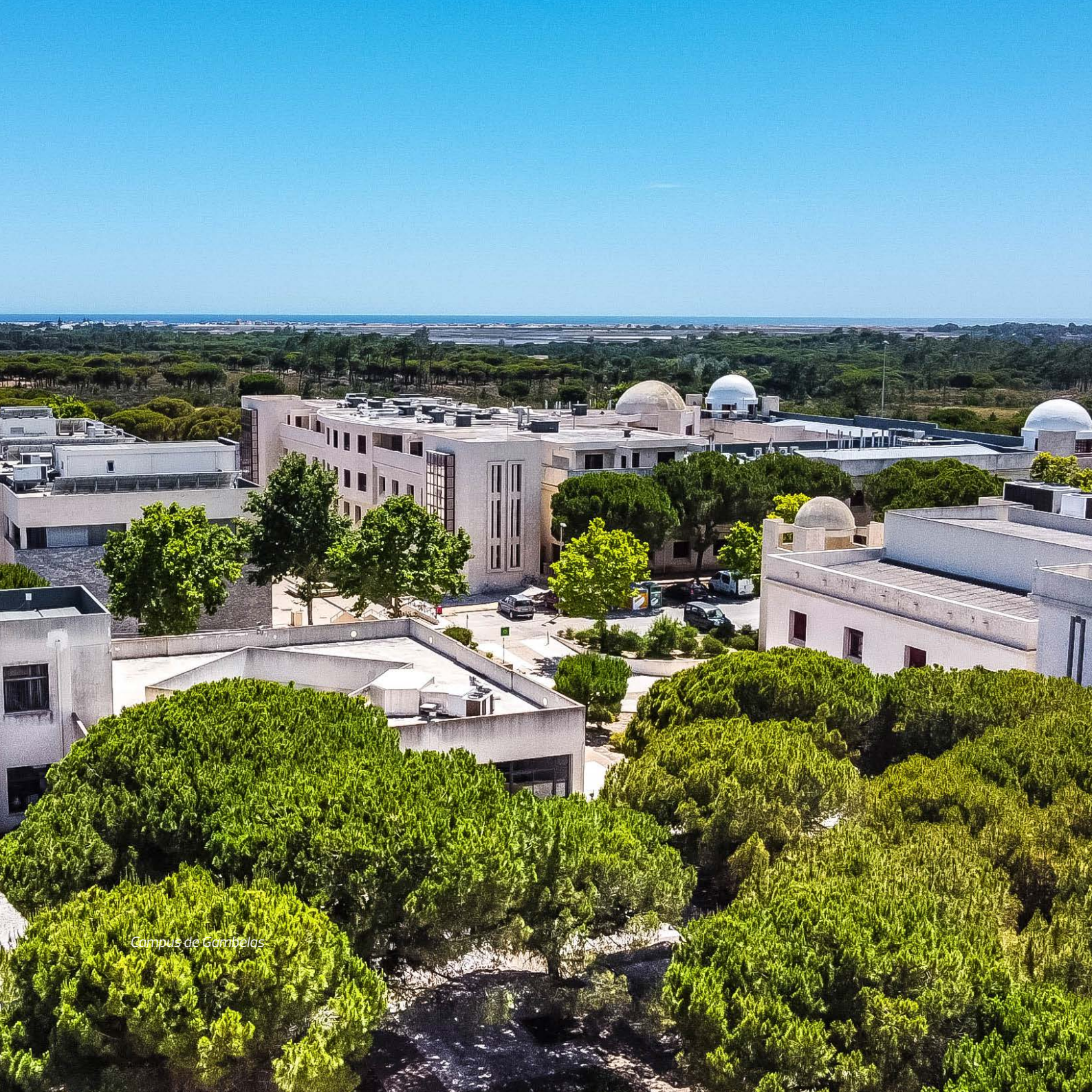
Campus de Gambelas